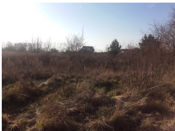
Fot.1-4 Widok na obszar inwestycji.

Zgodnie z wydanymi przez PWK Płonia Sp. z o.o. warunkami technicznymi projektowana sieć ks zostanie przyłączona do istniejącej sieci ks \Phi 200 położonej w dz. Nr 248/8, natomiast sieć wodociągową należy rozbudować od istniejącej sieci w \Phi 160 położonej w dz. Nr 273/10.